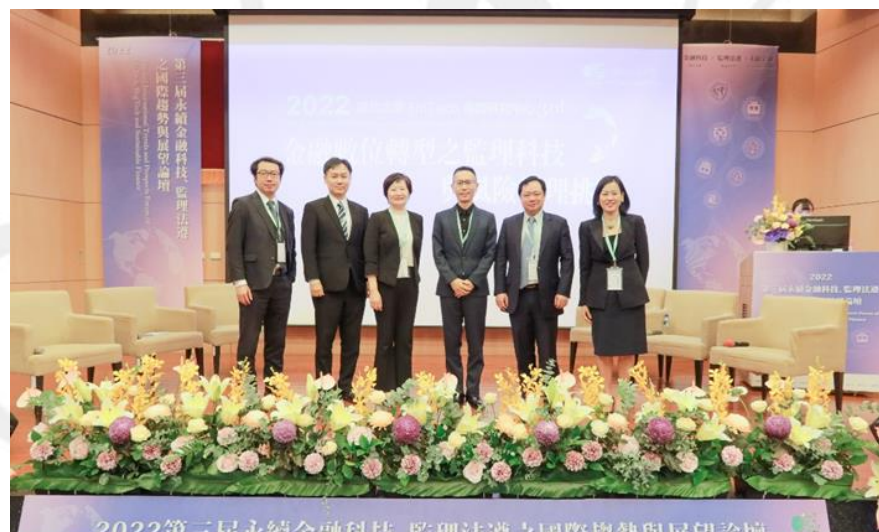
尤其偉副總（右三）出席國際論壇，擔任法令遵循科技實務場次之與談人